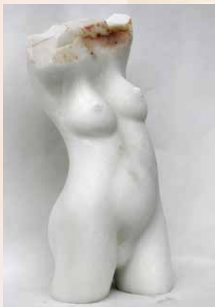
Luk Luts - verwachten

Momenteel loopt er een prachtige tentoonstelling met werk van Luk Luts en Monique Tevenie. Luk Luts maakt sculpturen uit diverse steensoorten. Het gam-