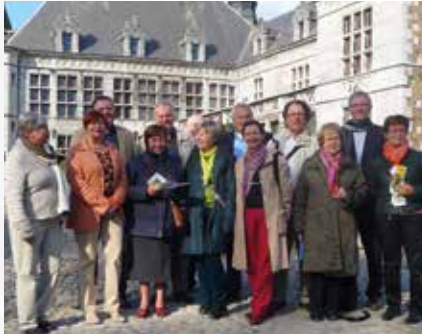
Gidsen voor kasteel van Jehay.