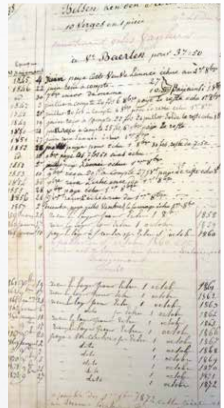
Een fragment uit het pachtregister van Alden Biesen.

De registers worden momenteel door Bilisium gescand. Ze zullen vervolgens uitgebreid bestudeerd worden. Je kan ze gaan bekijken in de lokalen van Bilisium op zondagvoormiddag tussen 9.30u en 12.00u. Daarna zullen ze terug naar Alden Biesen komen en zal hun verdere bestemming worden vastgelegd.