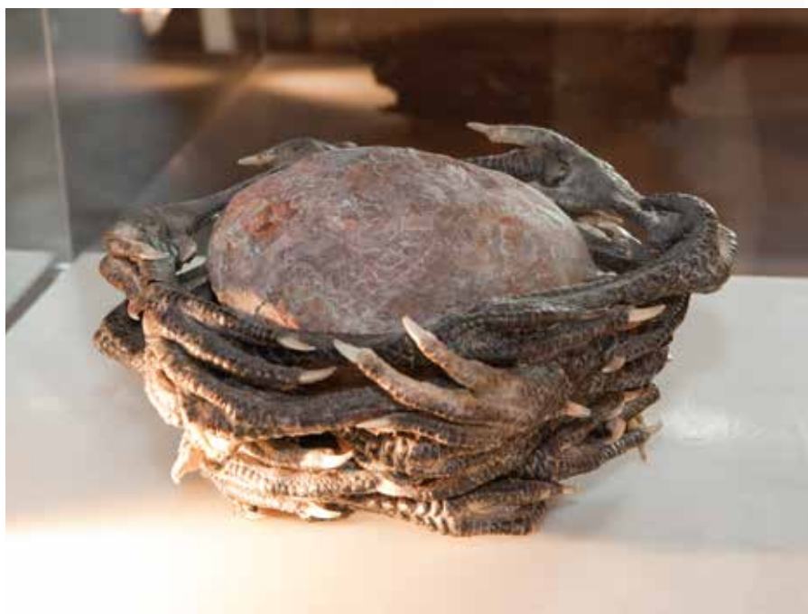
Carried by Generations