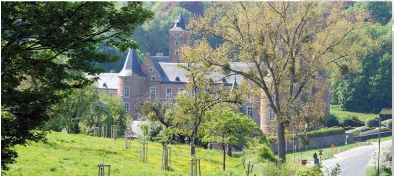
Lies Kerkhofs Directeur

allerlei openluchtactiviteiten, zonder bij nat weer in een modderpoel te veranderen en is alweer een nieuwe en extra troef in ons infrastructureel aanbod.