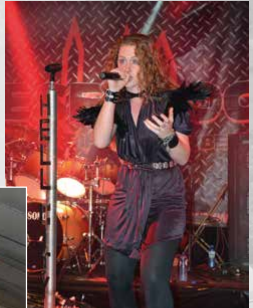
Metalband Hell City

Biesenrock, gesteund door de Vlaamse overheid, provincie Limburg, Stad Bilzen en landcommanderij Alden Biesen, bracht op 4 en 5 augustus vooral jong en aanstormend talent. De toegang was gratis. De opbrengst van de verkoop van T-shirts en armlintjes ging naar de voedselbank van Bilzen. Headliner op 4 augustus was de nieuwe Belgische metalband Hell City. Op zondag was Koyle de grote publiekstrekker.