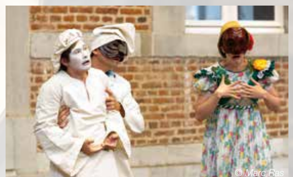
Spec. Street Creative Community