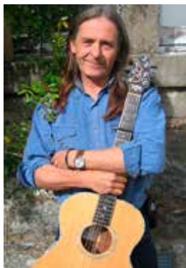
Dougie McLean (SCO)