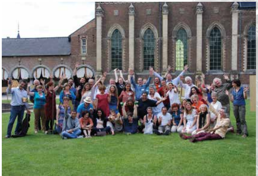
Deelnemers FEST-conferentie in Alden Biesen.

Alden Biesen was ook het toneel voor de eerste, officiële internationale FEST-conferentie. Van 4 tot 7 juli 2012 streken hier 50 deelnemers uit 17 verschillende landen neer met onder meer waarnemers uit Canada, Jordanië, Libanon en Palestina.