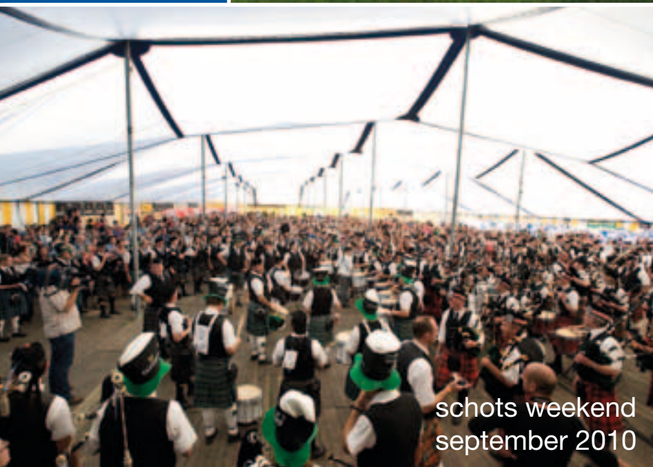
schots weekend september 2010