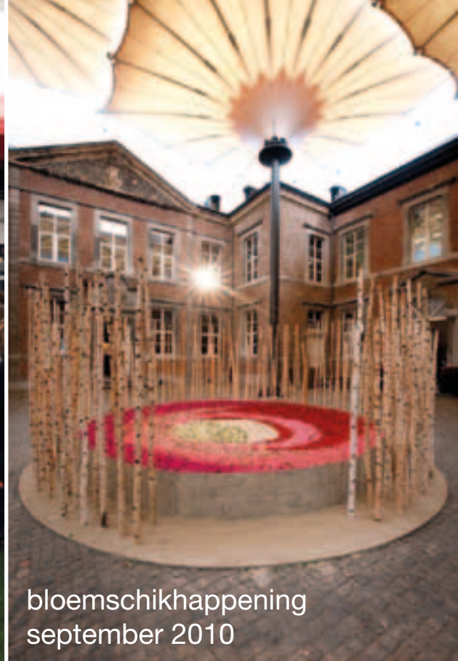
bloemschik happening september 2010