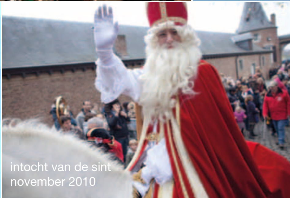
intocht van de sint november 2010