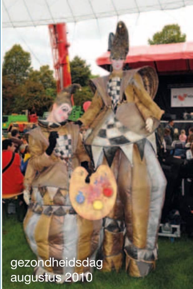
gezondheidsdag augustus 2010