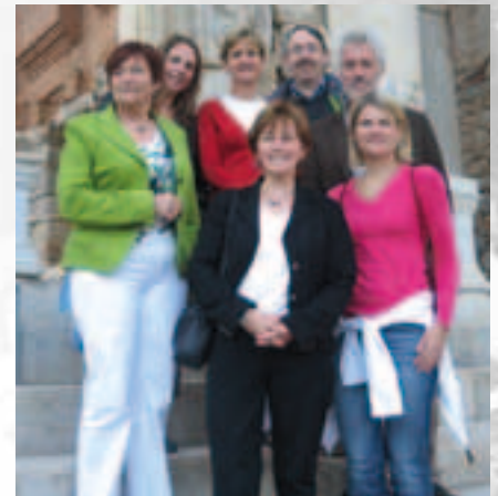
De Belg. delegatie op cultureel bezoek aan Ephesus ter afronding aan de GINCO-conferentie

Speciaal is ook dat in deze periode net de 'consultation round' plaatsvindt waarbij de Commissie feedback van het veld verzamelt met het oog op de uitwerking van de volgende generatie LLP-programma's (2013 - 2020). Op het einde van de conferentie was er dan ook een debat met de aanwezige vertegenwoordigers van de Commissie, EACEA, de NA's en GINCO. Op basis van al de rapporten zal het netwerk dan ook een reeks aanbevelingen formuleren voor deze consultatieronde.