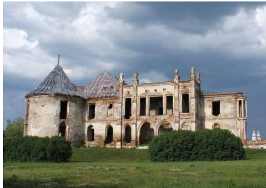
Kasteel Banffy, Bontida partner in het Aqueductproject en lid van het ACCR-netwerk.

Aqueduct is een Comenius Multilateraal project met als doel de verwerving van sleutelcompetenties door erfgoededucatie te verbeteren en leerkrachten (beter) op te leiden voor competentiegericht onderwijs in een erfgoedcontext. Het Aqueductproject, dat gecoördineerd wordt door Alden Biesen, richt zich tot leerkrachten, lerarenopleiders, leraren in opleiding, medewerkers van educatieve diensten van erfgoedorganisaties die willen investeren in competentiegericht onderwijs en in erfgoededucatie.