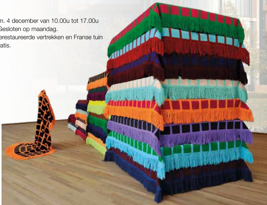
Fransje Killaars, 24 hours I, 2005

Inkom: € 3,00 incl. toegang gerestaureerde vertrekken en Franse tuin Kinderen tot 12 jaar gratis.