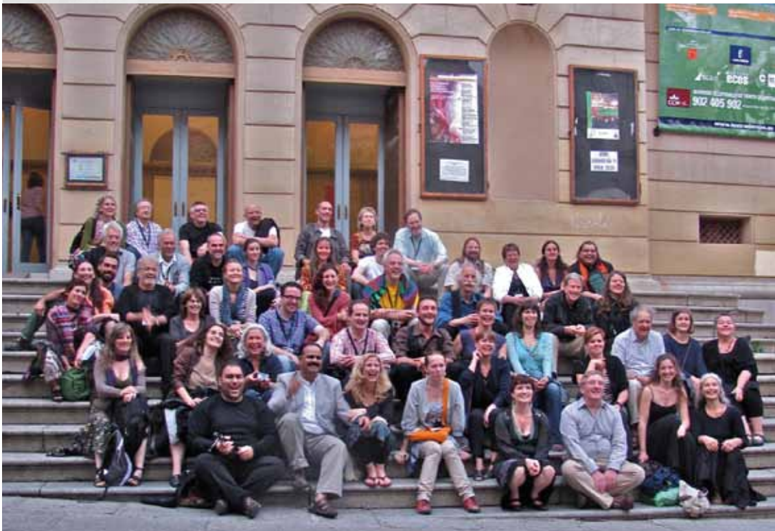
Deelnemers op de trappen van het Teatro de Rojas.

publiek zo open voor vreemde talen als in Vlaanderen. Toch vinden er ook in andere landen interessante experimenten plaats met bilingual storytelling; vaak vertellingen in combinatie van Engels met de moedertaal (Spanje en Italië). Vertellen en vertelkunst worden ook ingezet in sociale projecten om bijvoorbeeld migrantenjongeren meer in contact te brengen met de moedertaal van het land waarin ze wonen (Brunnenpassage in Wenen). Een hele reeks experimenten op dat vlak vinden plaats in Europa; een boeiend gegeven waarbij de FEST-deelnemers veel van mekaar leerden en afspraken maakten om samen te werken.