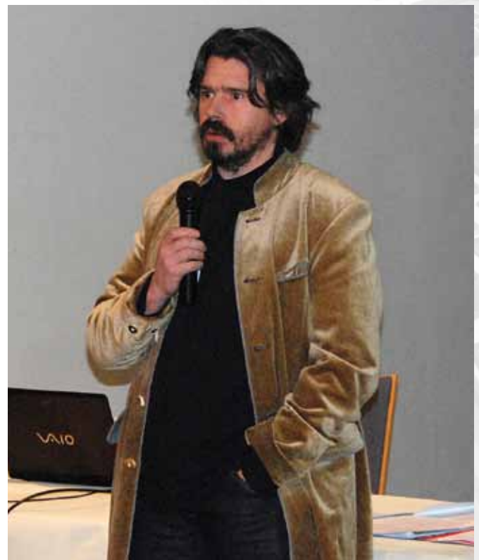
Koen Vanmechelen, Cosmopolitan Chicken project