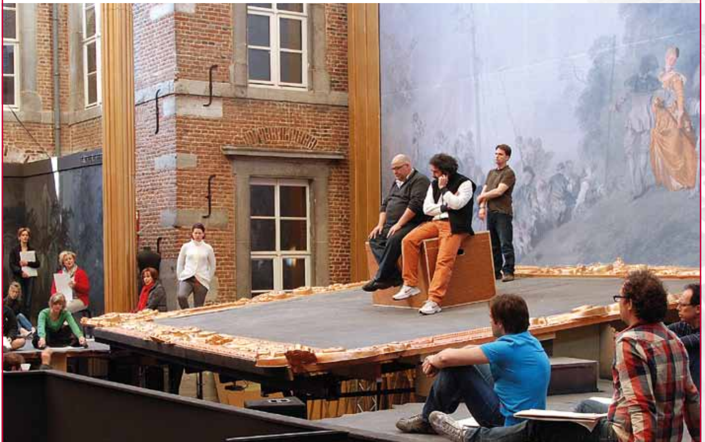
repetitie Zomeropera 2011