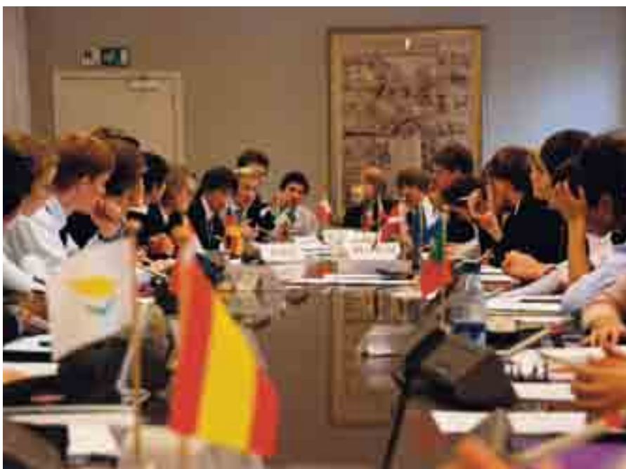
Europaklassen - Council of Ministers

Voor meer info: guy.tilkin@alden-biesen.be