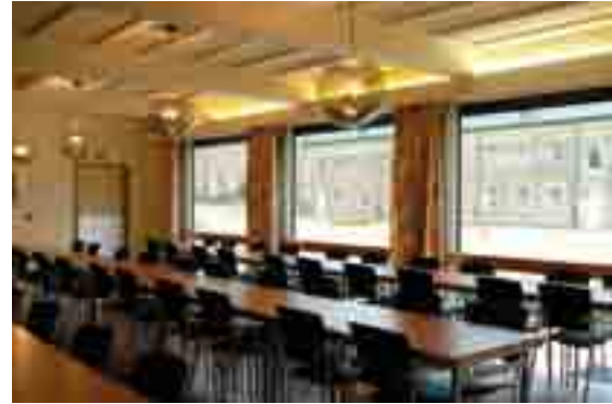
Restaurant Noordelijke Voorburcht: max. 65 pers. afh. van zaalopstelling

Alden Biesen beschikt over enkele grote vergaderzalen waaronder de Rijschool en de Tiendschuur, en - iets kleiner - de Bochholtz. De Rijschool is een polyvalente ruimte met mogelijkheid tot theateropstelling voor 300 personen. Verder zijn er de kleinere zalen , elk met zijn uniek karakter, voor 6 tot 60 personen. Ook wat maaltijden betreft is er voor ieder wat wils. De catering van Alden Biesen serveert je zowel een eenvoudig dagmenu als een uitgebreid diner in vijf gangen. Voor grotere groepen heeft de bezoeker de keuze uit verschillende traiteurs.