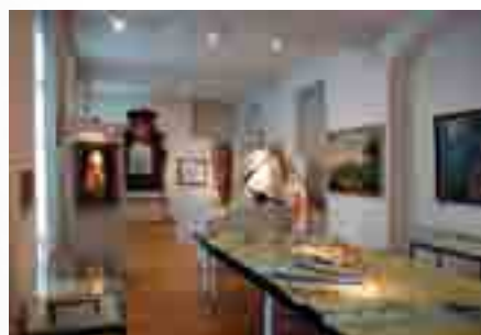
Nieuwe kapel, gelijkvloers kasteel

Ook de Oranjerie krijgt een facelift. Het sanitair wordt aangepast (toegankelijkheid voor andersvaliden), de keuken heringericht, de vloeren vernieuwd. Dit met het oog op een toekomstig intensief gebruik van deze aangename ruimte met terras in de Franse tuin.