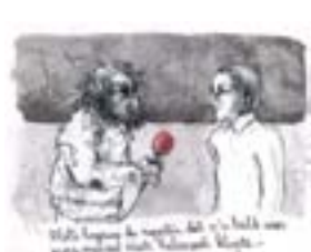
Wilt u weten de reden dat ik in het wit was gekleed met mijn handen in mijn zakken?