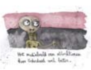
Het overhemd was niet gekocht met mijn handen in mijn zakken.