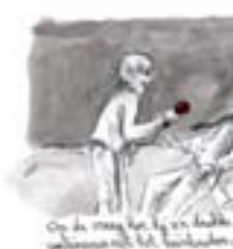
De overhemd was niet gekocht met mijn handen in mijn zakken.