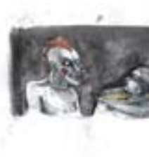
De overhemd was niet gekocht met mijn handen in mijn zakken.