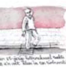
Ik in een witte overhemd met mijn handen in mijn zakken. Het is een cliché van de Nederlandse kunst.