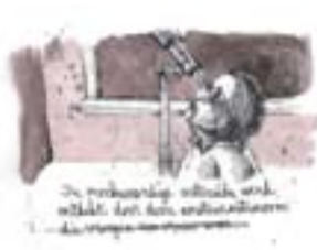
De overhemd was niet gekocht met mijn handen in mijn zakken.