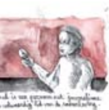
Ik in een witte overhemd met mijn handen in mijn zakken. Het is een cliché van de Nederlandse kunst.