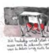
De overhemd was niet gekocht met mijn handen in mijn zakken.