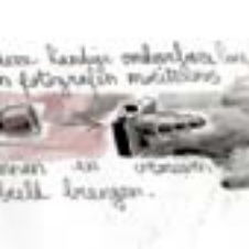
Ik in een witte overhemd met mijn handen in mijn zakken. Het is een cliché van de Nederlandse kunst.