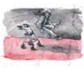
Wilt u weten de reden dat ik in het wit was gekleed met mijn handen in mijn zakken?