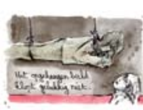
Het overhemd had ik niet gekocht met mijn handen in mijn zakken.