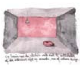
Wilt u weten de reden dat ik in het wit was gekleed met mijn handen in mijn zakken?