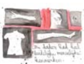
Het overhemd was niet gekocht met mijn handen in mijn zakken.