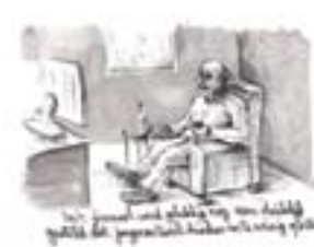
De overhemd was niet gekocht met mijn handen in mijn zakken.